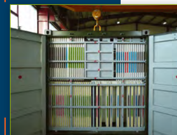
■ Unité d'emballage de 20 ft. Conteneur de fret pour le transport maritime, ferroviaire et routier