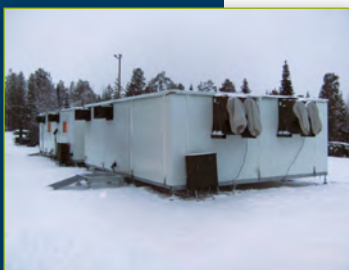
■ Aspect extérieur