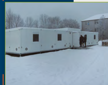
■ Aspect extérieur Ulm