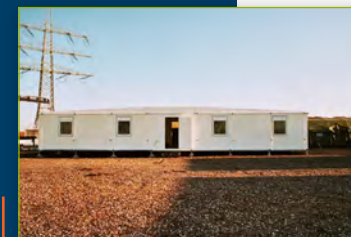
■ Aspect extérieur Coblenz