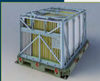
■ Unité d'emballage pour le transport maritime et ferroviaire, par camion et hélicoptère