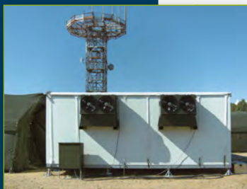
■ Cuisine roulante avec entrepôt frigorifique et de congélation