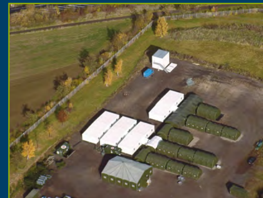
Vue aérienne du projet FHQ