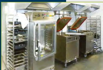
■ Équipement de cuisine