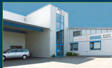
Siège social à Balingen

Le groupe d'entreprises NARR dispose d'une expérience de plus de 50 ans en matière de construction de chambres frigorifiques ; il s'est spécialisé dans la conception et la production d'éléments isolants pour le génie frigorifique et climatique, les salles blanches et la protection contre l'incendie sur une plage de température allant de + 80 °C à - 110 °C. 80 collaborateurs – 10 millions d'euros de C.A.